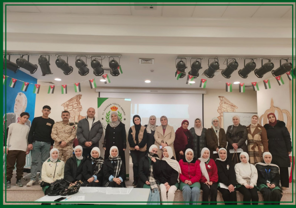
مدرسة خولة بنت الازور - مديرية التربية والتعليم الرصيفة يوم الإثنين ٢٠٢٦/٣/٢