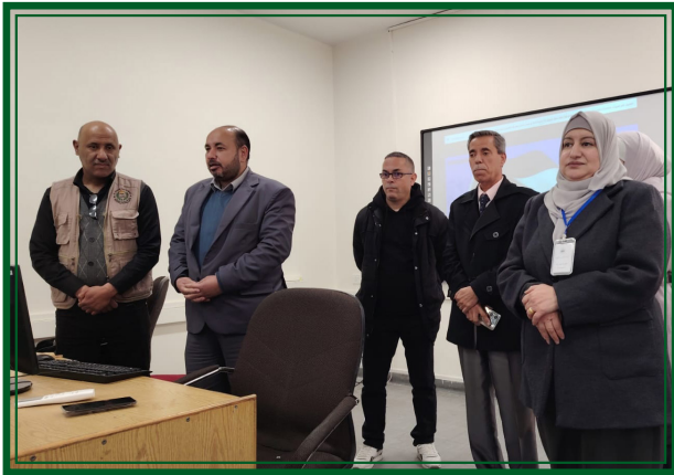
مدرسة القصور الثانوية للبنات - مديرية التربية والتعليم لواء ماركا يوم الخميس ٢٠٢٦/٣/٥