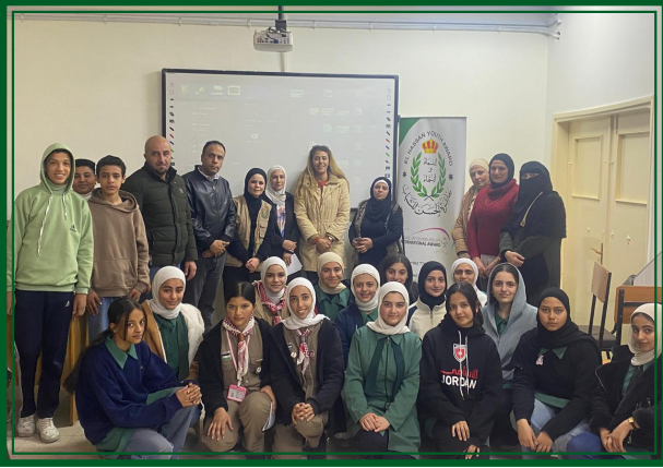
مدرسة عين الباشا الثانوية للبنين - مديرية التربية والتعليم عين الباشا يوم الأربعاء ٢٠٢٦/٣/٨