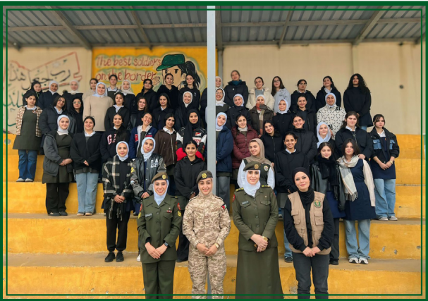
مدرسة فاطمة الزهراء الثانوية للبنات - مديرية الثقافة العسكرية إقليم الوسط يوم الاثنين ٢٠٢٦/٣/٣٠