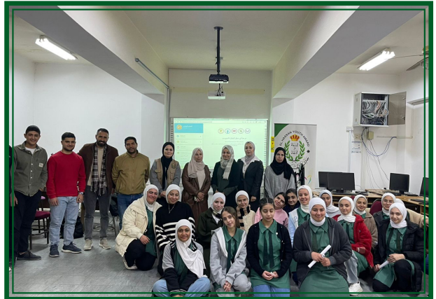
مدرسة الملكة زين الشرف الثانوية للبنات - مديرية التربية والتعليم الكرك يوم الخميس ٢٠٢٦/٣/٩