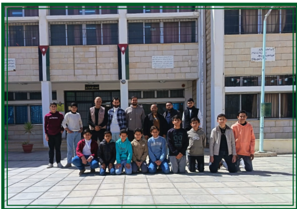
مدرسة ايل الثانوية للبنين -مديرية التربية والتعليم لواء البادية الجنوبية يوم الخميس ٢٠٢٦/٣/١٢