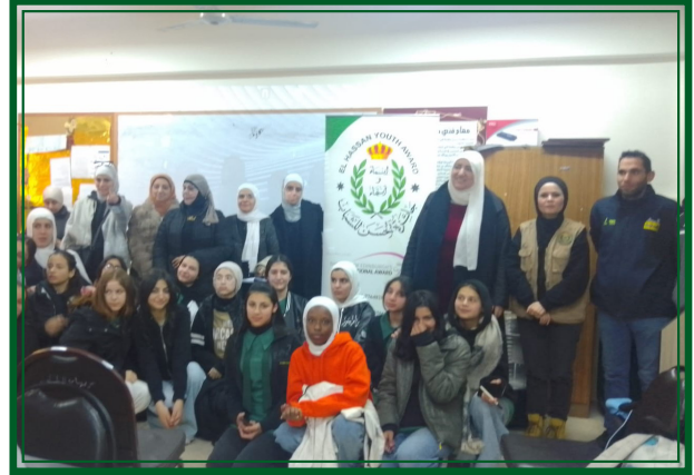
مدرسة ام حبيبة الأساسية للبنات - مديرية التربية والتعليم وادي السير يوم الأحد ٢٠٢٦/٣/١