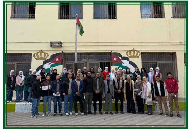
مدرسة سعد بن عبادة الاساسية للبنين - مديرية التربية والتعليم لواء القويسمة يوم الاربعاء ٢٠٢٦/٣/٤