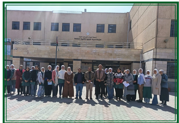
مدرسة نسبية المازنية الثانوية المختلطة - مديرية التربية والتعليم لواء ماركا يوم الاربعاء ٢٠٢٦/٣/١١