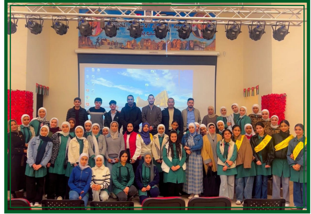
مدرسة الخنساء الأساسية المختلطة - مديرية التربية والتعليم الشونة الجنوبية يوم الإثنين ٢٠٢٦/٣/٢